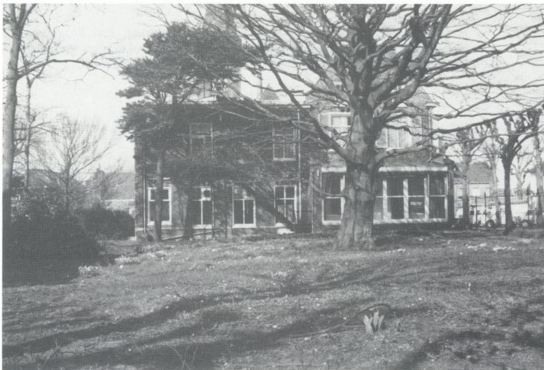
De tuin voor de verbouwing