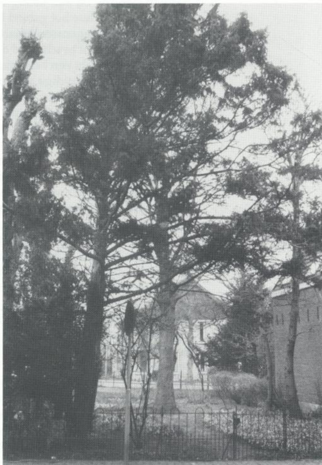
Het hekje van de overtuin