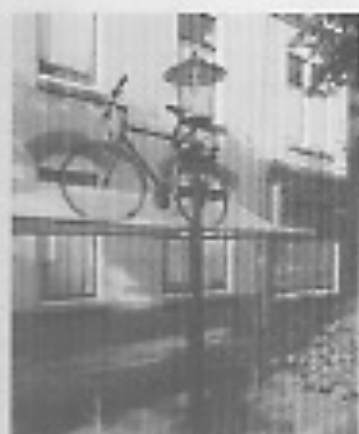
Hier geldt een omhoogslap- regeling